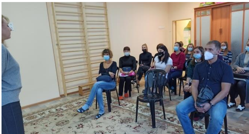
Засідання мультидисциплінарної команди із залученням батьків

Для організації підтримки сімей, які мають дитину з важкою формою інвалідності, застосовувався комплексний підхід що дозволяє попередити інституціалізацію таких дітей. Так, корекційно-розвиткові послуги включали в себе консультативно-інформаційну підтримку батьків. Батьків запрошували на засідання мультидисциплінарної команди, надавалися поради щодо роботи з дитиною вдома.