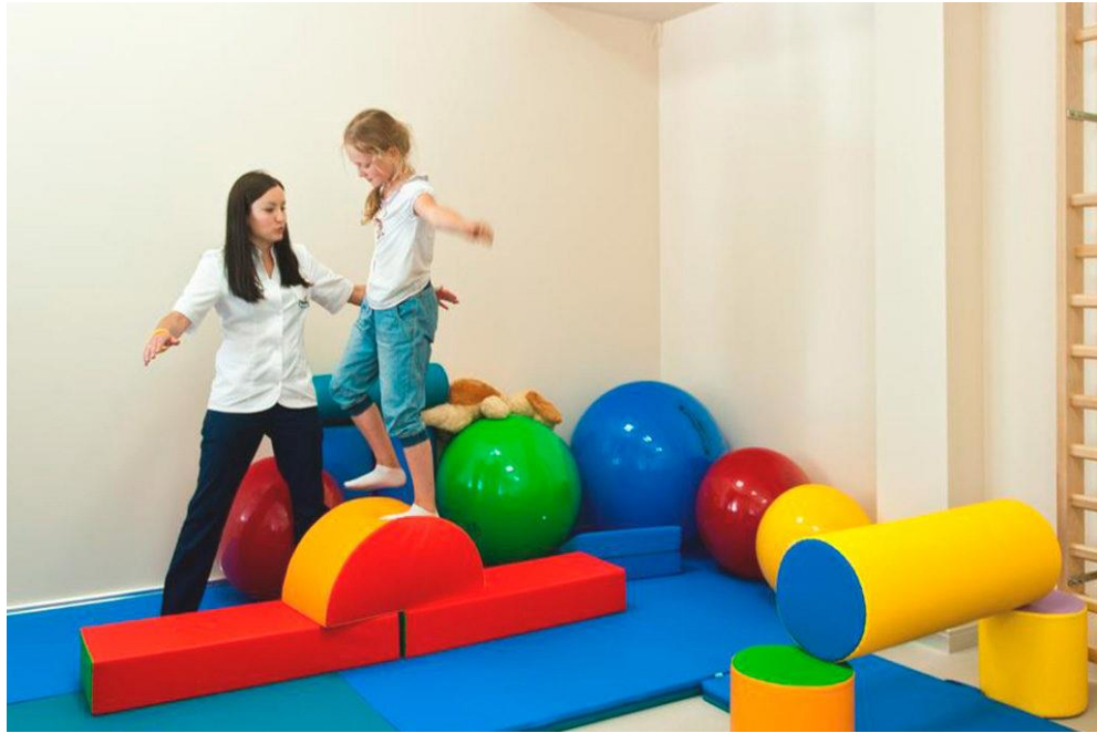
Заняття з ЛФК