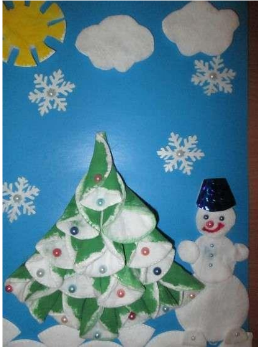
Робота, виконана на майстер-класі

За кошти членів «БЛАГОДІЙНОЇ ОРГАНІЗАЦІЇ «ВСЕУКРАЇНСЬКИЙ БЛАГОДІЙНИЙ ФОНД «АЛЬТЕРНАТИВА. ГАРМОНІЯ» було придбано матеріали для проведення занять з арт терапії та різноманітних майстер-класів (МК). Наприклад, матеріали для виготовлення новорічних прикрас з фетру, також альбоми, кольоровий папір та картон, фарби, маркери, глину та інші. Усі ці матеріали були використанні під час проведення парцетерапії, майстер-класів та інших занять.