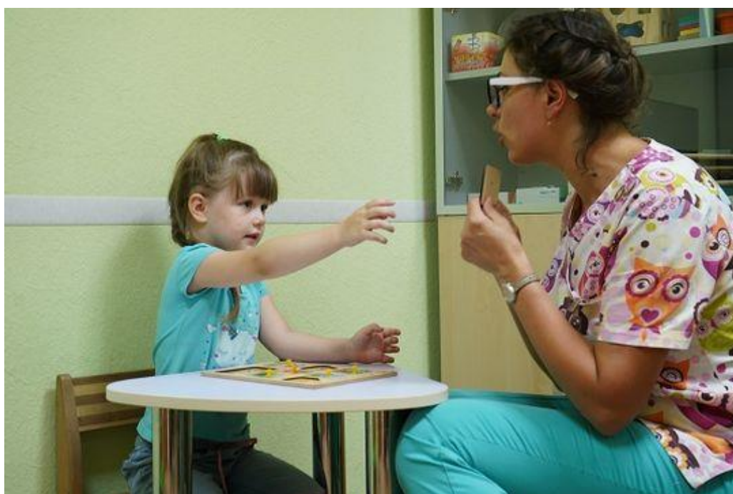
Заняття з дефектологом