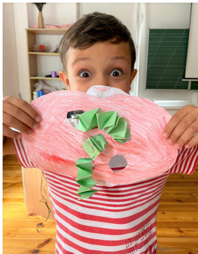
Заняття з арт-терапевтом