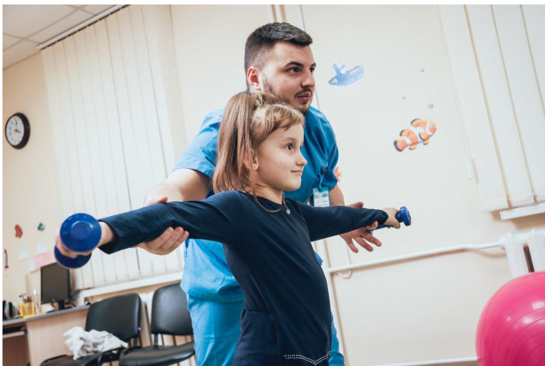
Заняття з ЛФК