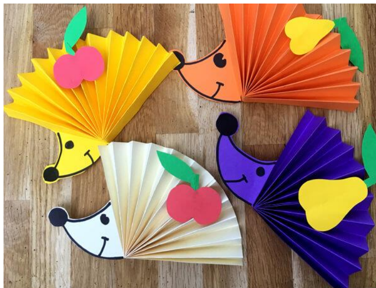
Роботи, виконані на занятті з арт-терапії