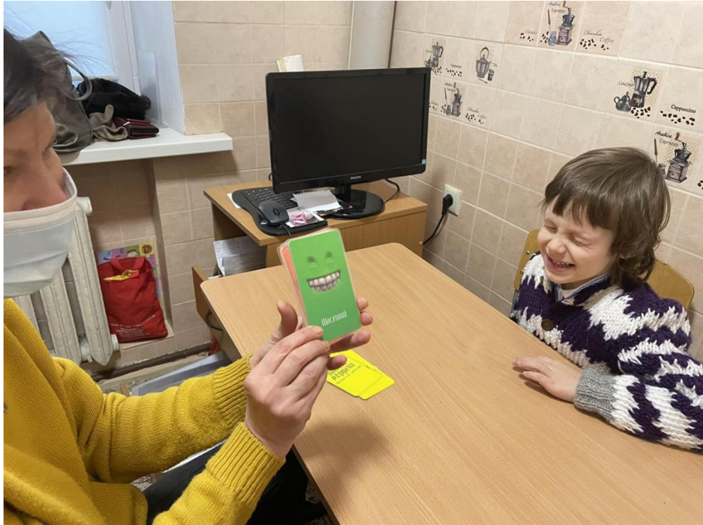
Заняття з психологом