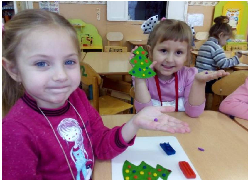
Майстер-клас виготовлення ялинок з фетру