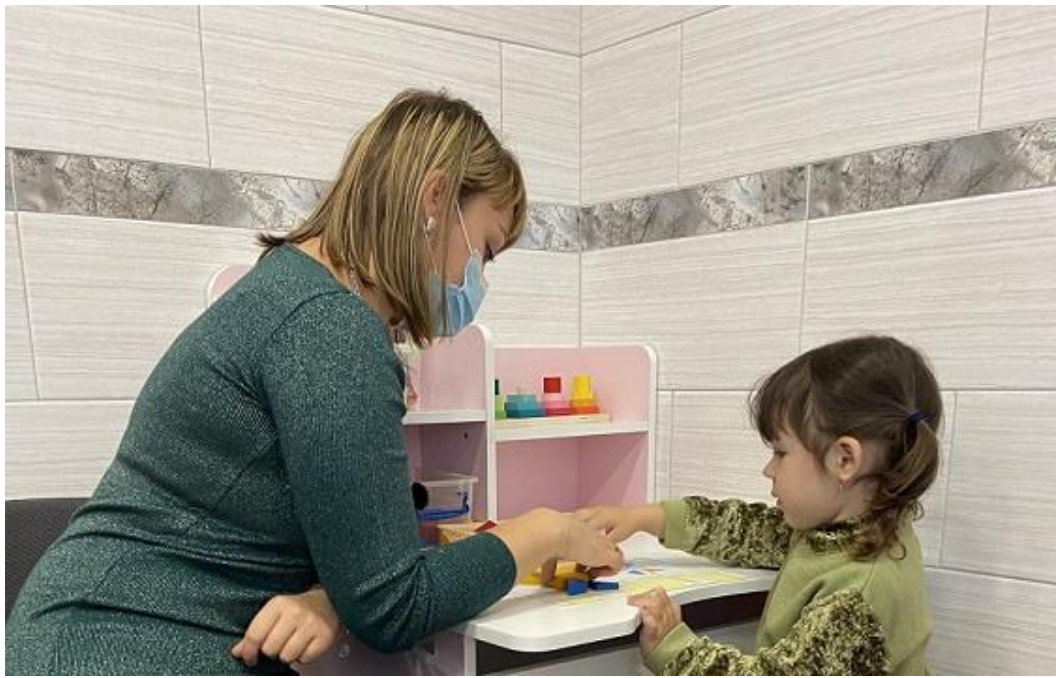
Заняття з дефектологом