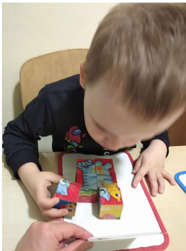
Заняття з психологом