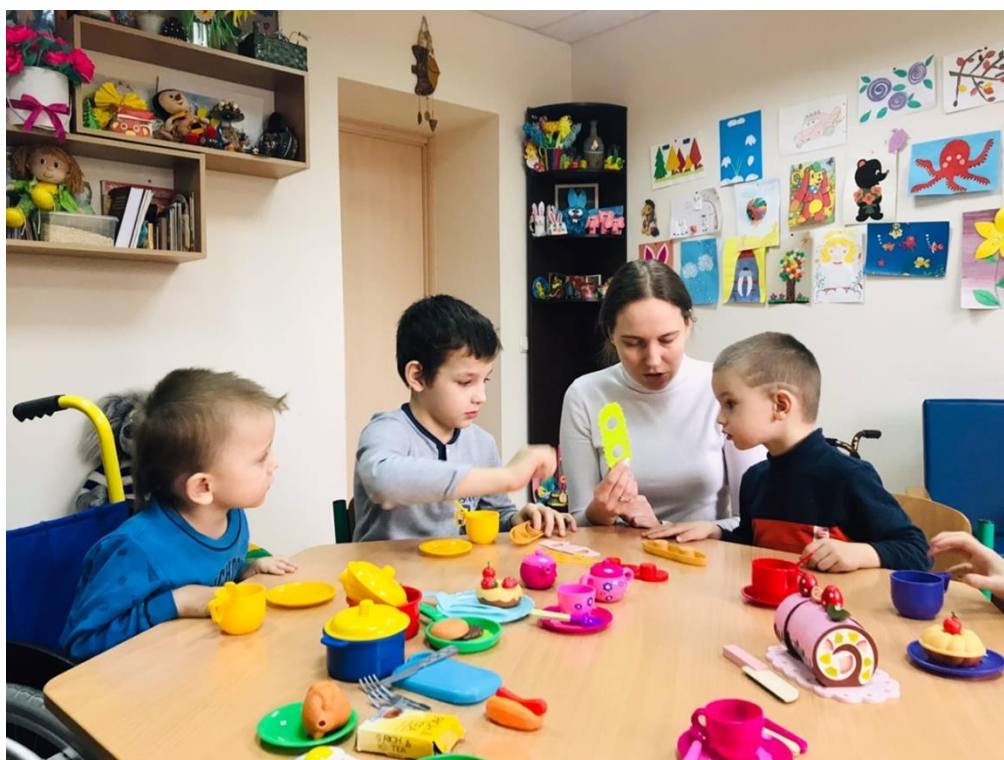
Групове заняття з соціалізації

Організації групових занять з соціалізації,