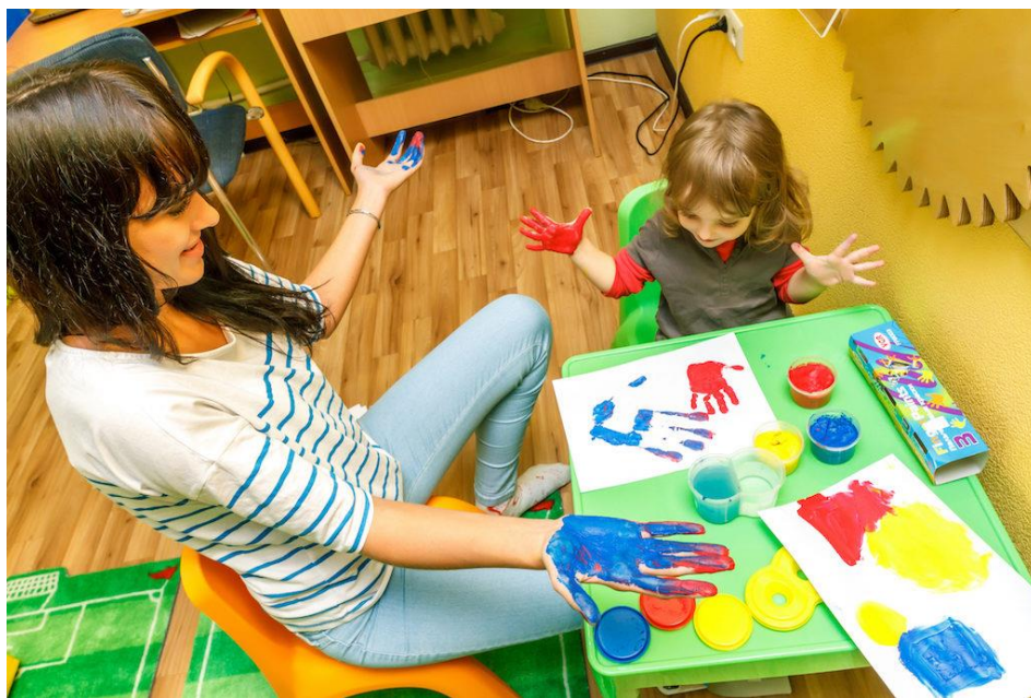
Заняття з арт-терапентом