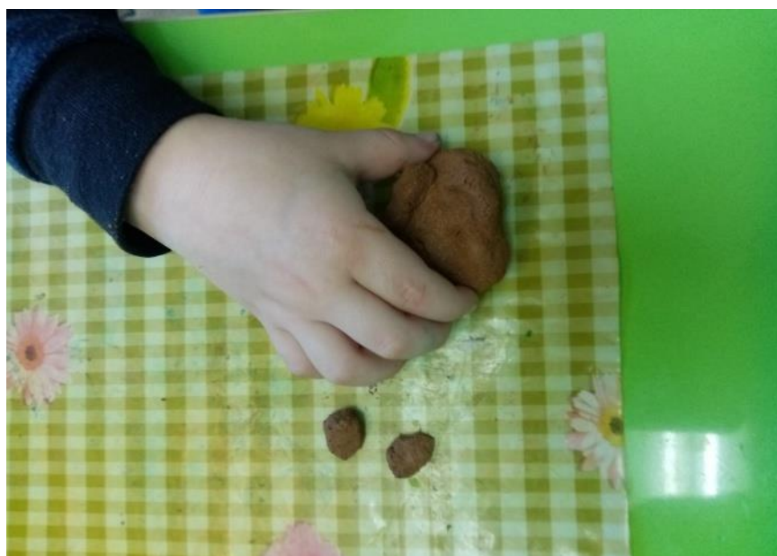
Майстер-клас виготовлення іграшки з глини «Кошеня»