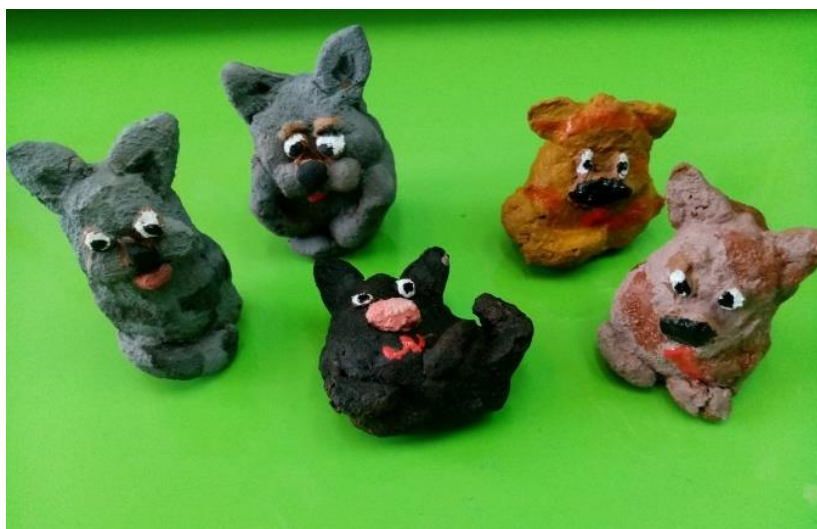
Майстер-клас виготовлення іграшки з глини «Кошеня»