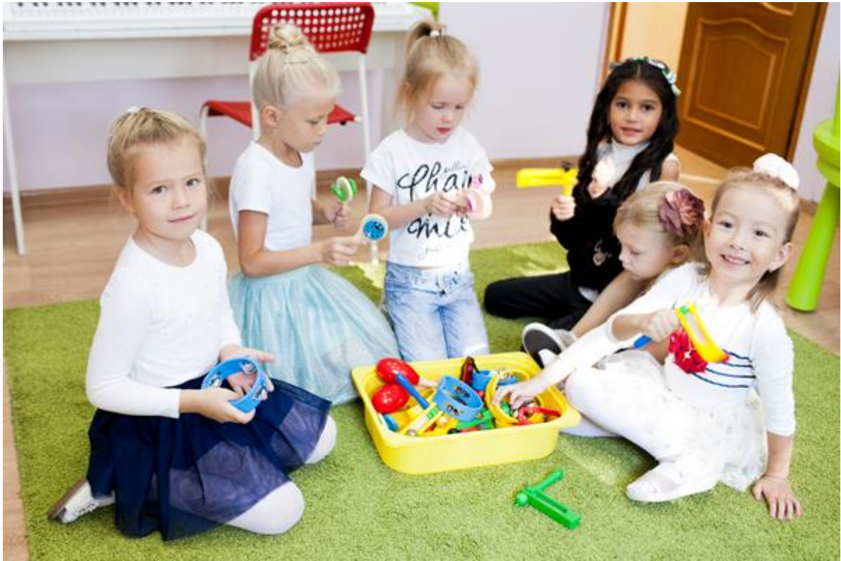
Заняття з музики