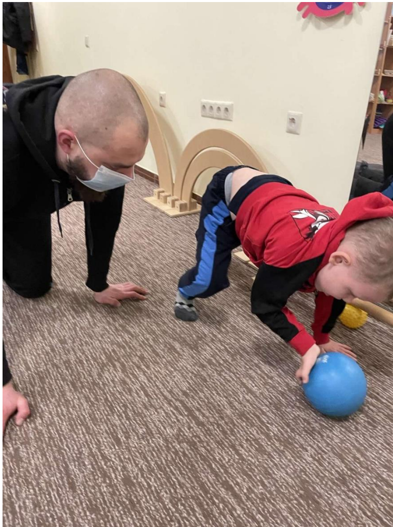
Заняття з нейропсихологом

Роботи з психологом і фахівцем з адаптивної фізкультури.