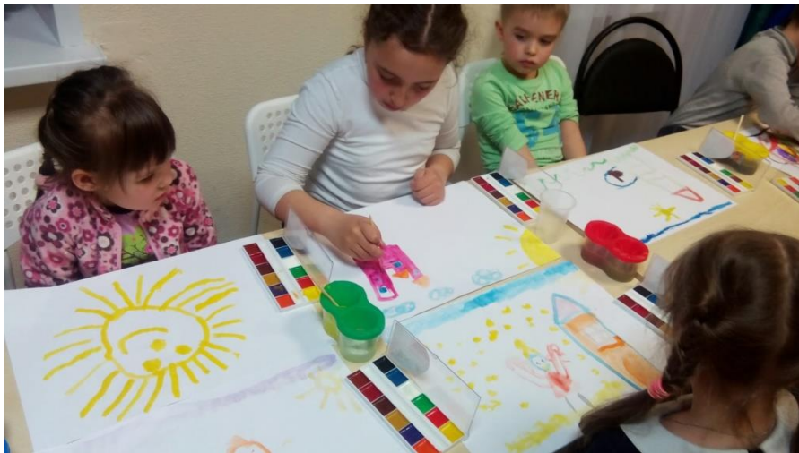
Заняття з арт-терапії