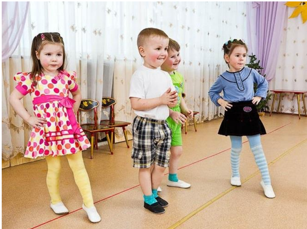
Заняття з музики