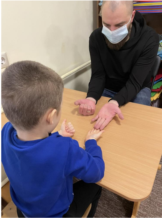
Заняття з нейропсихологом