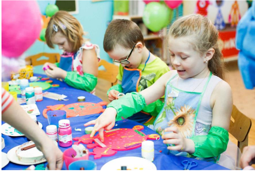
Заняття з арт-терапії