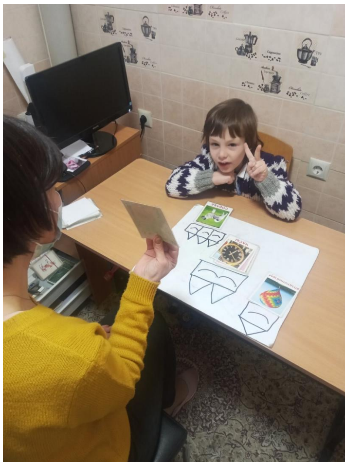
Заняття з логопедом