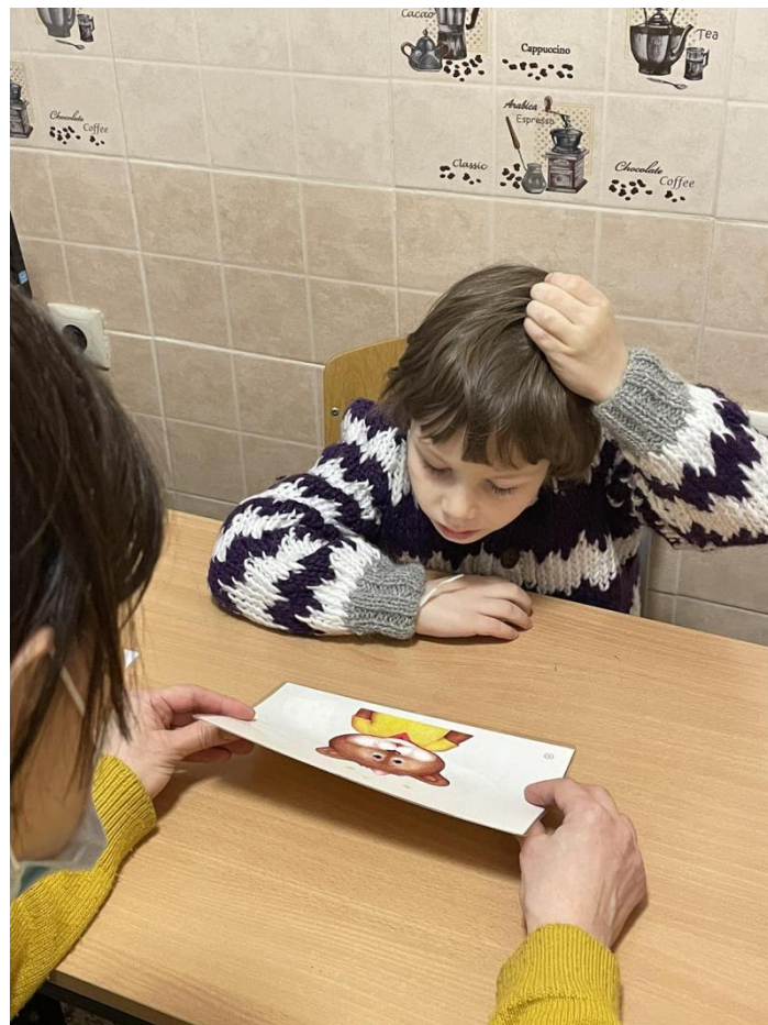
Заняття з психологом