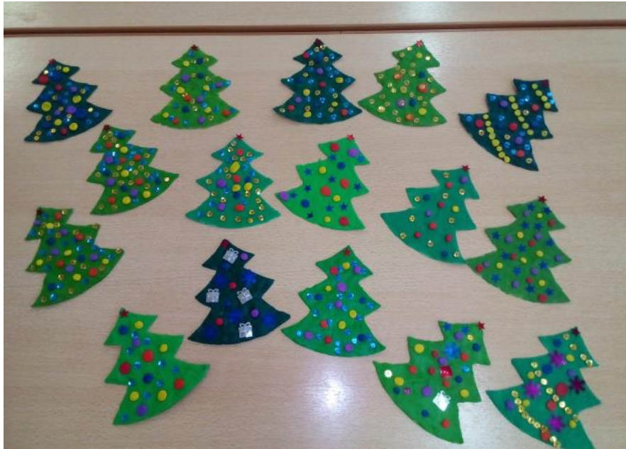
Майстер-клас виготовлення ялинок з фетру