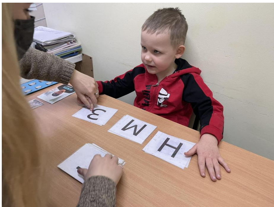
Заняття з логопедом