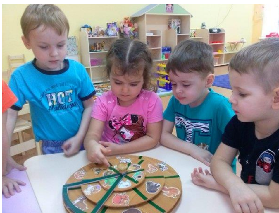
Групове заняття з соціалізації