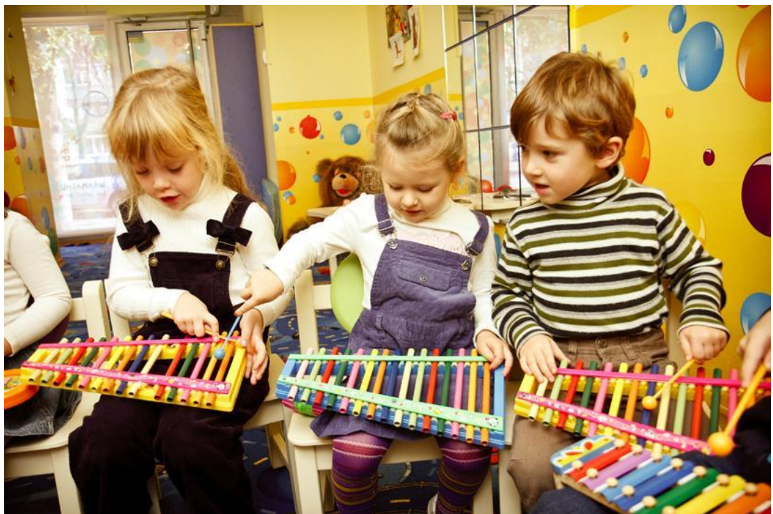
Заняття з музики