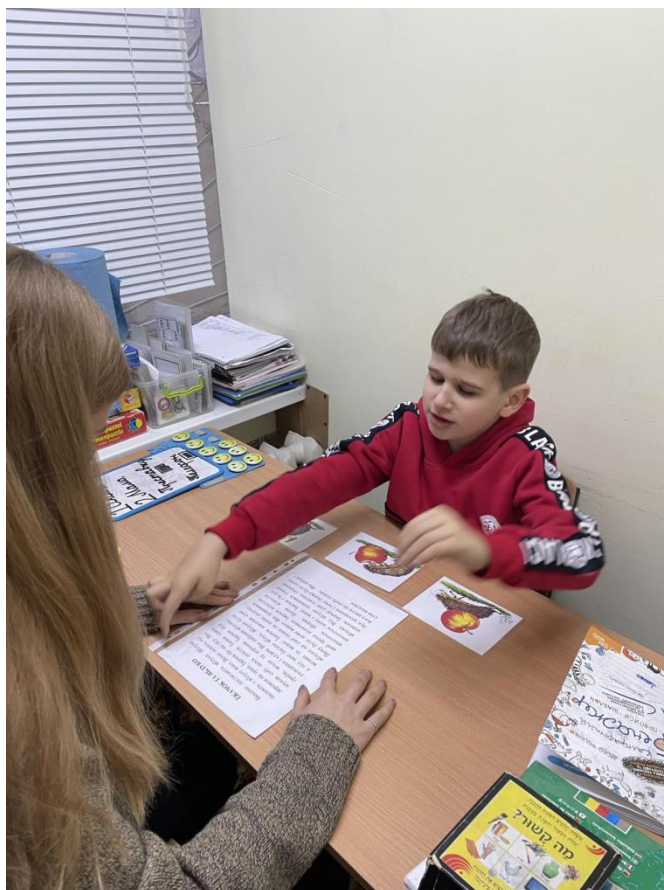
Заняття з логопедом